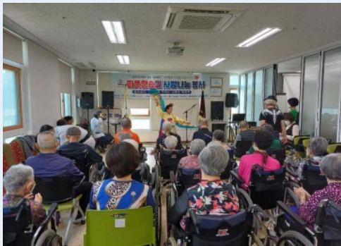
외부강사 초청 프로그램 진행

어르신들과 함께 우리나라의 24절기에 따라 우리 조상들의 지혜를 배우며 프로그램을 진행하면서 익숙하고 편안한 일상생활을 영위하며, 즐거움을 함께 느끼고, 서로서로 소통하며 노년의 행복함과 의미를 느끼시며 지내시는 남천안노인요양원입니다.