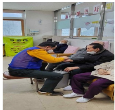
어르신을 향한 다정한 손길