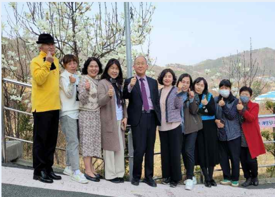
사람이 꽃보다 아름다워~~

남천안노인요양원 산업체위탁 사회복지학과는 2017년에 시작하여 사회복지사 인력양성에 선도적인 역할을 해오고 있습니다. 꾸준히 사회복지사를 교육 및 배출하고 있으며, 즐겁고 재밌는 수업을 제공하고 있습니다. 또한 교육생에게 취업연계를 위해 노력하고 있습니다.